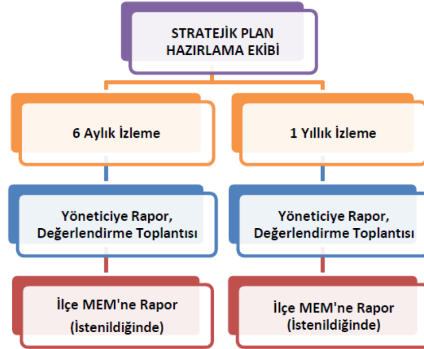
Şekil 1. İzleme ve Değerlendirme Süreci

Müdürlüğümüzün 2024-2028 Stratejik Planı İzleme ve Değerlendirme sürecini ifade eden İzleme ve Değerlendirme Modeli hazırlanmıştır. Okulumuzun Stratejik Plan İzleme- Değerlendirme çalışmaları eğitim-öğretim yılı çalışma takvimi de dikkate alınarak 6 aylık ve 1 yıllık sürelerde gerçekleştirilecektir. 6 aylık sürelerde Okul Müdürüne rapor hazırlanacak ve değerlendirme toplantısı düzenlenecektir. İzleme-değerlendirme raporu, istenildiğinde İlçe Milli Eğitim Müdürlüğüne gönderilecektir.