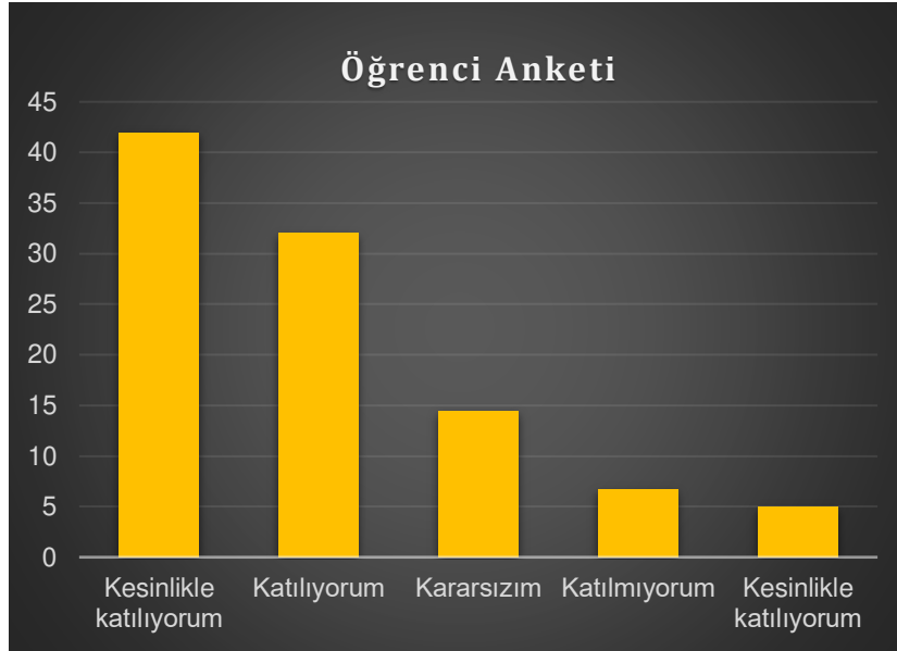
Tablo 5. Paydaş değerlendirme anketi - Öğrenci